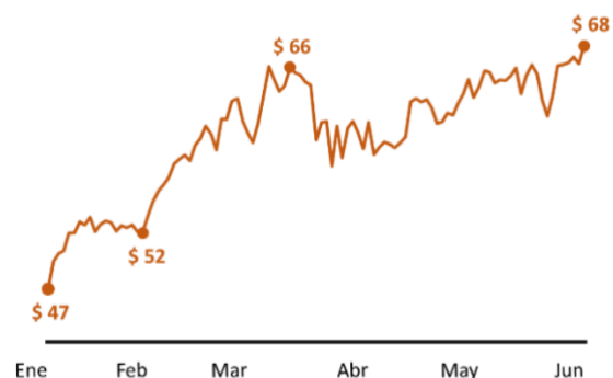
Precio del barril de petróleo WTI alrededor de los $ 70

Fuente: Energy Information Administration Al 03-Jun de 2021