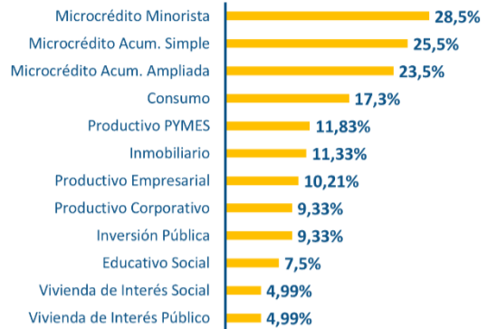
Tasa máxima de interés por segmentos (Sistema Financiero Nacional)

Fuente: Banco Central del Ecuador Septiembre 2020