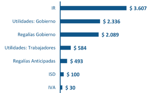
Estimación de beneficios del proyecto minero MIRADOR Millones de USD

Según la Investigadora y Consultora energética Wood Mackenzie, el proyecto minero Mirador generaría probablemente al Ecuador un valor en exportaciones de $ 36.478 millones entre el año 2019 y 2049.