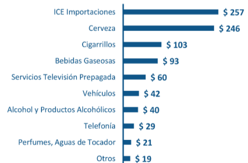
Recaudación del Impuesto a los Consumos Especiales Año 2019 - Millones de USD

Para este 2020, a partir de la última reforma tributaria aprobada en diciembre pasado, se espera que el ICE genere mucho mayor recaudación. Se ha comenzado a implementar el ICE a las bebidas azucaradas, a los plásticos, y a los servicios pospagos de Telefonía celular. Así mismo se ha reformulado el método de cobro del ICE a las cervezas y bebidas alcohólicas, cigarrillos y vehículos.